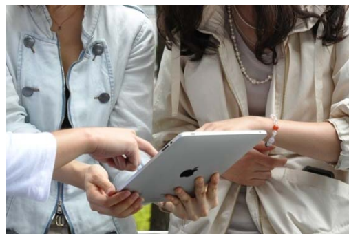
【タブレット PC からの視聴イメージ】