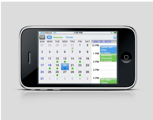
ハイブリッド表示 (月/ 日)