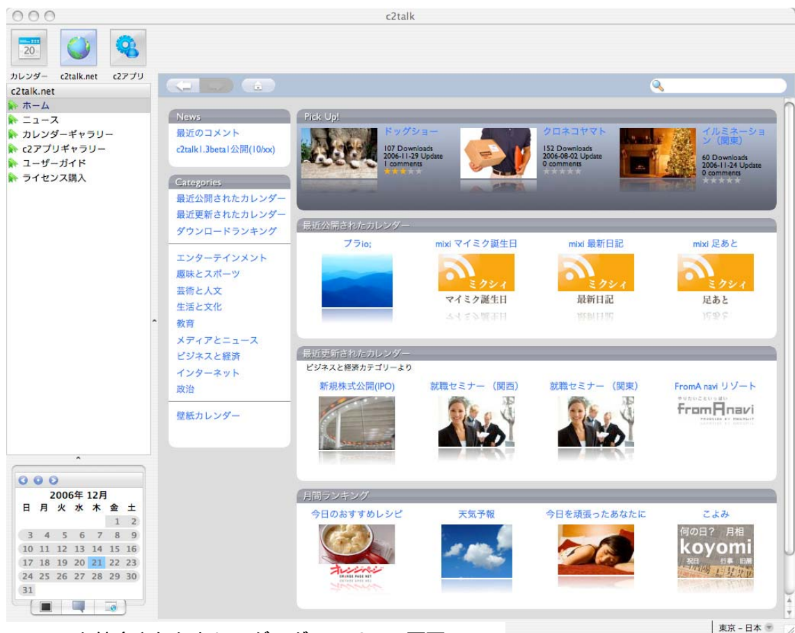
c2talk と統合されたカレンダーギャラリーの画面

c2talk Xmas beta 版は、現在開発中のバージョンであり、動作の安定性は保証されませんが、Xmas beta 版で実装予定の新機能をいち早くユーザーの皆様にご利用し確認していただくために、提供するものです。インフォテリアでは、今後、利用者からのフィードバックをできるだけ早く組み込んで提供できる様、今後も開発の進展に伴って「beta 版」のアップデートを実施する予定です。