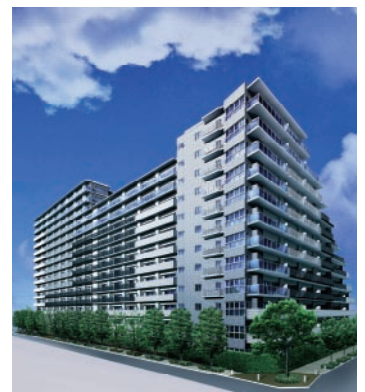
ローレルコート南浦和

近鉄不動産は、2006年夏から経理システムなどを皮切りに、基幹システムの見直しを始めた。その一環として、住商情報システムの統合型次世代ERPパッケージ「ProActive E 2 」を導入することになった。さらにインフォテリアのEAIツール「ASTERIA WARP」を採用し、ProActive E 2 と既存システムのスムーズなデータ連携を実現した。操作性に優れたGUIをサポートするASTERIA WARPによって、近鉄不動産は開発工程の短縮化を実現し、さらに将来にわたる拡張性や柔軟性も手に入れることができた。