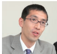
㈱テレビ東京 情報システム局システム部主事