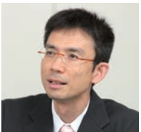
㈱テレビ東京 情報システム局システム部長