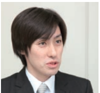
㈱テレビ東京システム 業務部主事