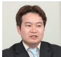
㈱テレビ東京システム 業務部主事