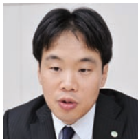
企画本部 経営情報システム部 技師