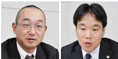
企画本部 経営情報システム部 部長代理

これらの課題を解決するために、日立システムは自社システムの顧客情報を統合(以下、統合