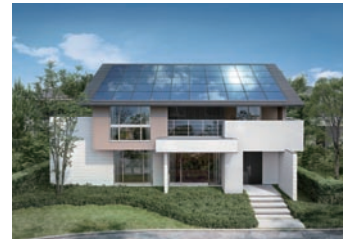
太陽光発電システムを搭載した「MyForest-Solabo(マイフォレスト-ソラボ)」

高品質な木造戸建住宅を提供する住宅メーカーとして知られる住友林業株式会社。国土の1000分の1にあたる約4万ヘクタールの社有林を保有し、山林経営から木材・建材の製造・流通・販売、木造住宅の建築まで、総合住生活関連事業をグローバルに展開している。同社は国際会計財務報告基準(以下、IFRS)に対応するため、会計システムのリプレースを実施した。その際、毎年のように発生する各種の法体制の変化やコンバージェンスにも柔軟に対応できるように、会計システムと周辺システムとのデータ連携のためのインターフェースも統一した。連携基盤のインターフェースとして選ばれたのは、ASTERIA WARPだった。