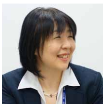
オリックス不動産株式会社 運営事業本部 水族館事業部