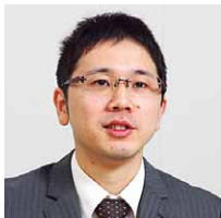
社会福祉法人 恩賜財団 済生会熊本病院 医療支援部 医療情報システム室