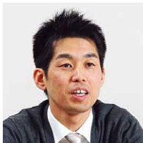
社会福祉法人 恩賜財団 済生会熊本病院 医療支援部 医療情報システム室 主任