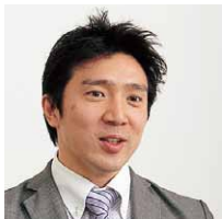
ライオン株式会社 統合システム部