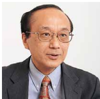
ライオン株式会社 統合システム部 部長