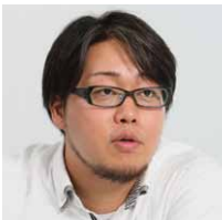
株式会社ダーツライブ 情報システム課