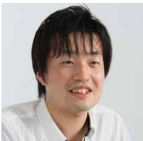
株式会社ダーツライブ 情報システム課