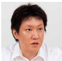
双日食料株式会社 情報企画部