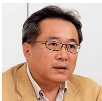
双日食料株式会社 情報企画部 部長