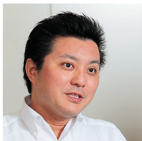
大和物流株式会社 情報システム部 係長