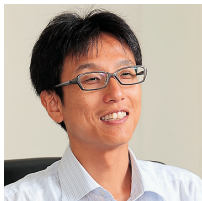
大和物流株式会社 経理部 課長