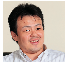
大和物流株式会社 業務推進部 業務推進室 主任

具体的には、ASTERIA WARPはGUIによるフロー開発で、多様なデータの変換、受け渡し、システム連携を容易に実現する。例えば、処理を開始するための「トリガー機能」