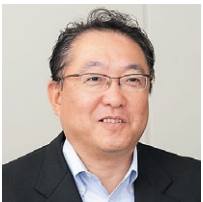
伊藤忠テクノソリューションズ株式会社 情報システム部 部長