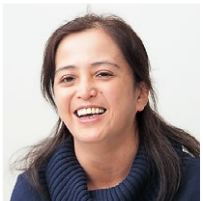
伊藤忠テクノソリューションズ株式会社 情報システム部 インフラシステム課