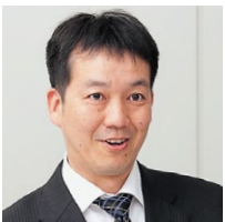
伊藤忠テクノソリューションズ株式会社 情報システム部 アプリケーションシステム第1課 課長