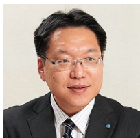
近畿産業信用組合 事務部 システム開発課 課長