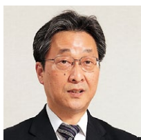
近畿産業信用組合 事務部 副部長