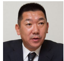
一般財団法人東京保健会 病体生理研究所 事務長

2つ目が、連携先の追加が容易なシステムであることだ。「改修の手間やコストができるだけ抑えられる、柔軟性の高い仕組みを求め