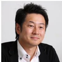
株式会社 ルミネ Eコマース事業部