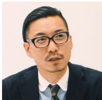
株式会社 ルミネ Eコマース事業部 アシスタントチーフ

首都圏の主要駅でショッピングセンター事業を展開する株式会社 ルミネ。実店舗の販売強化と同時に、ECサイト「i LUMINE (アイルミネ)」の集客にも力を入れている。同社は、一般のi LUMINE Eコマース基盤リプレースに合わせてASTERIA WARPを採用。ECサイトへの新規出店および商品登録を容易にし、多くのショップや商品が集まる魅力的なECサイトを実現した。実店舗との在庫情報の連携によるオムニチャネル化も促進している。