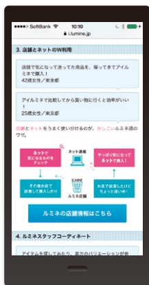
実店舗とi LUMINEを併用することで、買い物方がより便利に楽しめる。ASTERIA WARPは、様々なデータの連携により、そのためのシステム基盤を担っている