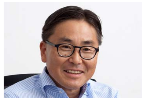
↑東京工業大学 千葉明 教授