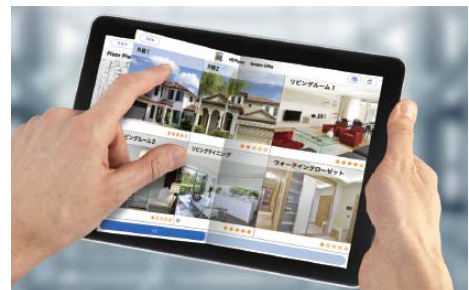
↑教育現場への導入が進む 「Handbook」

昨今、大学や専門学校を中心に、学生個人のスマートフォンやタブレットを授業や予習復習に利用する試みがスタートしています。インフォテリアでは今後も、教育現場はもちろん新たな分野でも「Handbook」の活用方法を積極的にご提案してまいります。