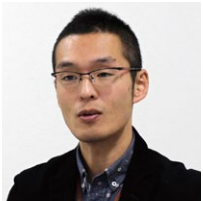
株式会社F・O・ホールディングス 情報システム課 ソリューション企画チーム 兼 情報基盤チーム 係長