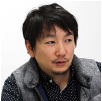
株式会社F・O・ホールディングス 情報システム課 課長