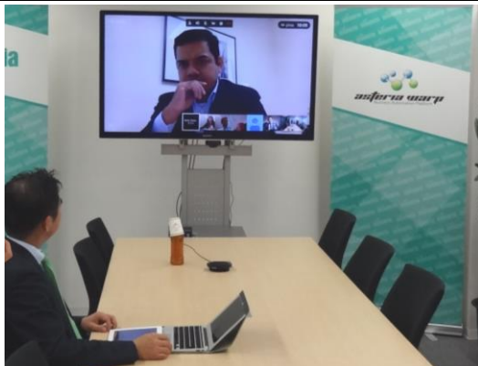
本社の社長と TV 会議システムでつないで 開催された取締役会（午前 10 時スタート）