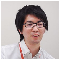
ヤンマー情報システムサービス株式会社 販売管理システム部 部品システムグループ