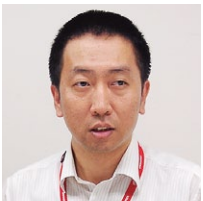
ヤンマー情報システムサービス株式会社 販売管理システム部 部品システムグループ