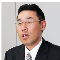
株式会社J-オイルミルズ 情報システム部 課長