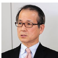
株式会社J-オイルミルズ シニア・エグゼクティブ・マネージャー 情報システム部長

また、ASTERIA WARPの場合、新たにExcel形式のファイルがそのまま簡単に扱えるようになる点も魅力だったという。