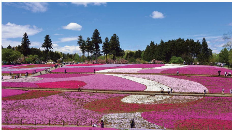
埼玉県の観光名所の1つ、羊山公園の芝桜。毎年4月中旬ごろから見頃となる

現在、ASTERIA WARPの連携フロー構築・運用などは、新しい電子申請システム全体の提案を行ったベンダーに一任している。だが今後は、情報システム課内でのスキル習得度合いも見ながら、徐々に内製化を進めていく予定だ。「これが実現されると、新たな処理要件の発生に素早く対応できるほか、コスト削減も図れます。アイコンのドラッグ&ドロ