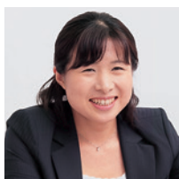
株式会社アンテリオ ファーマ・ソリューション事業部 ソリューション開発部 チームリーダー