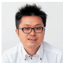
株式会社アンテリオ ファーマ・ソリューション事業部 ソリューション開発部長