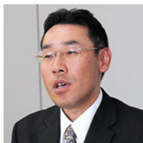
株式会社J-オイルミルズ 情報システム部 課長