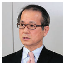
株式会社J-オイルミルズ シニア・エグゼクティブ・マネージャー 情報システム部長

また、ASTERIA Warpの場合、新たにExcel形式のファイルがそのまま簡単に扱えるようになる点も魅力だったという。