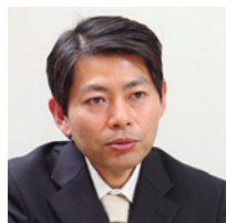
ベネトン ジャパン株式会社 システムDiv. 部長