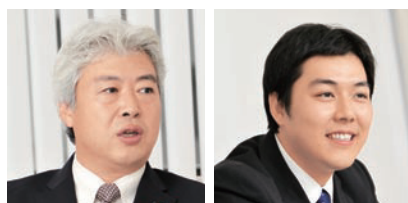
生産本部長兼 システム統括部担当部長