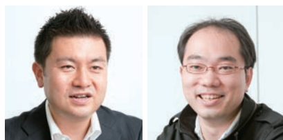
事業戦略室 マーケティンググループ グループリーダー