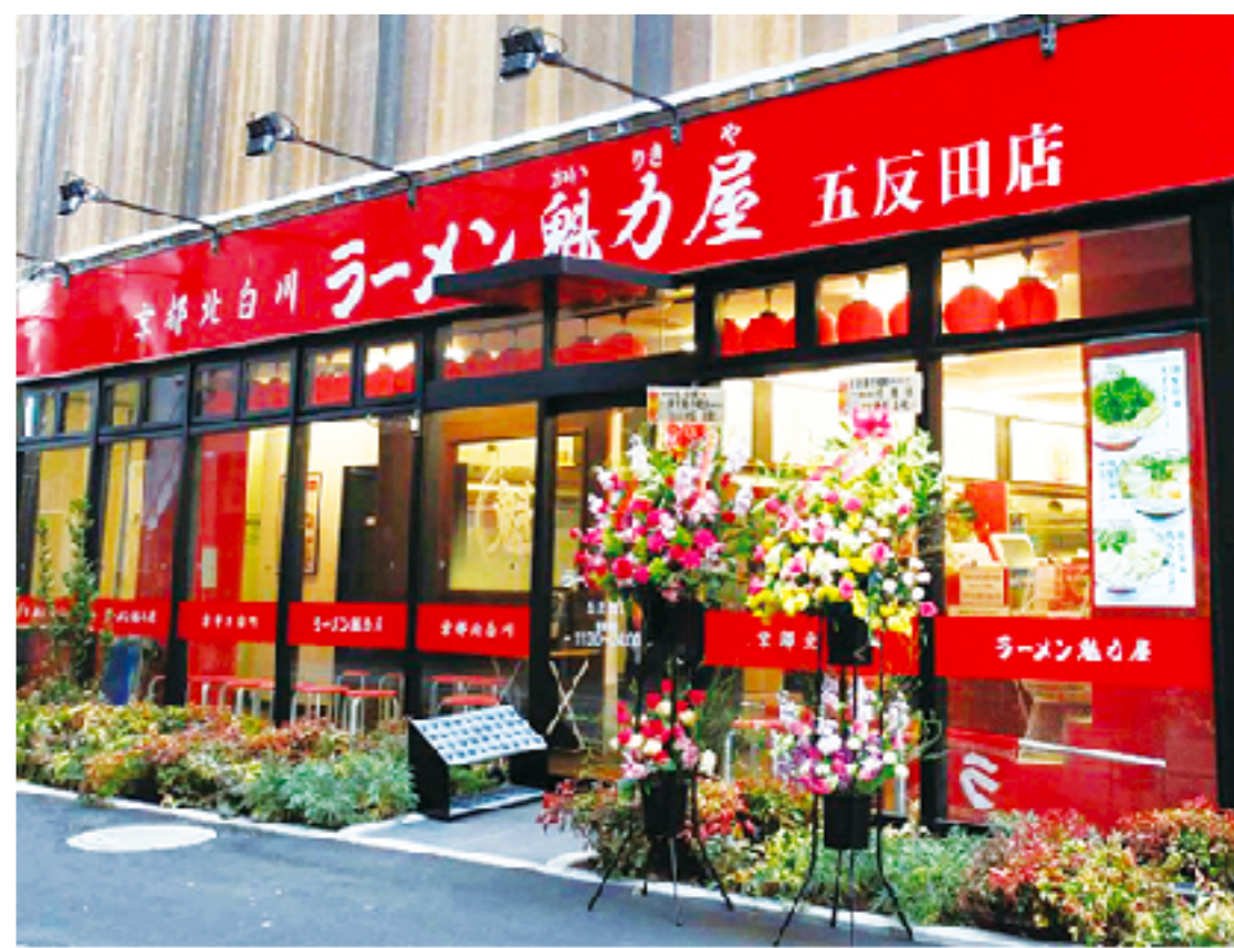
ラーメン「魅力屋」様の事例公開