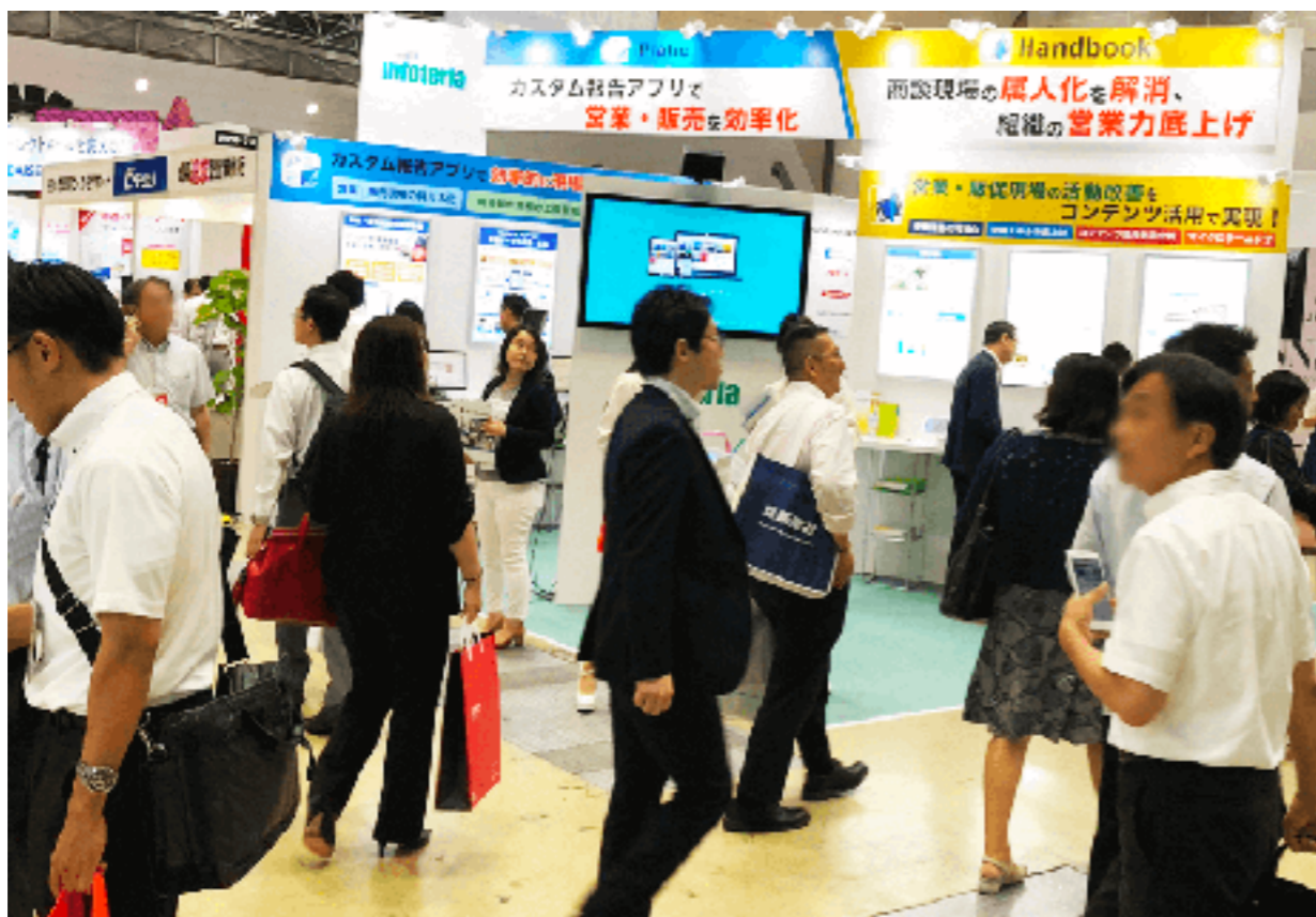
第5回営業支援EXPOでの展示説明