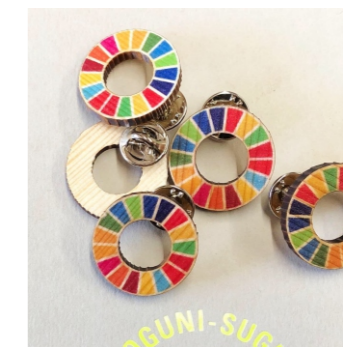
木製SDGsバッジ4種セット ピン2個・マグネット2個/カラー各2種 2,420ポイント