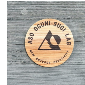
★森をつくるコースター 丸型Φ85mm or 角型85mm角×3.6mm 550ポイント