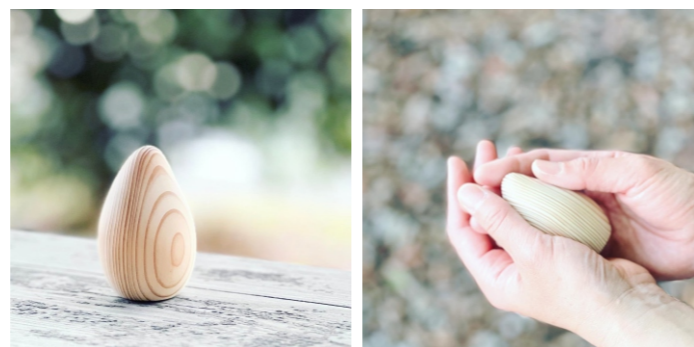
★職人がみがいた とっておきの撫で杉 4,510ポイント