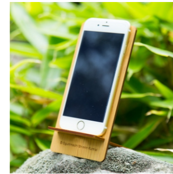
★モバイルスタンド 880ポイント

★マークはオリジナルノベルティ製造可能です 印刷・彫刻デザインは持込 / 100個以上から（ポイントは1個あたり）