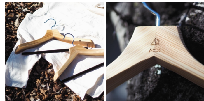
森をつくるハンガー(メンズorレディース) 約430×57mm / レディース約380×57mm 各8,800ポイント