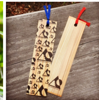
★ブックマーク 154ポイント