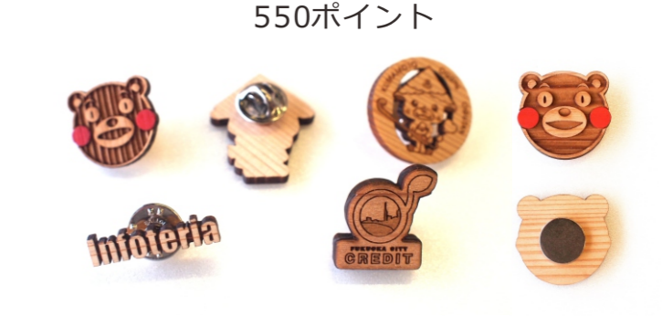
★マグネット/ピンバッジ/キーホルダー 30×30×3mm程度まで 550ポイント