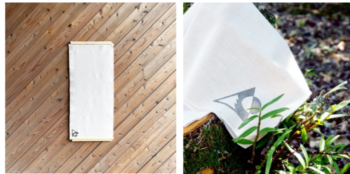
森をつくる手ぬぐい 約395×900×1mm 2,200ポイント