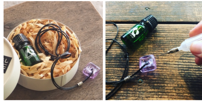
小国の森のエッセンシャルオイル 小国杉精油5ml - pendant box 4,400ポイント ※ペンダント色は パープルまたはグリーンでお任せください