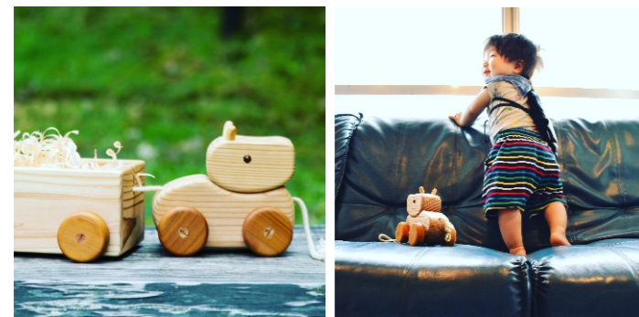
阿蘇小国ジャージー牛プル玩具 約92×140×125mm ※牛本体のみ 9,900ポイント