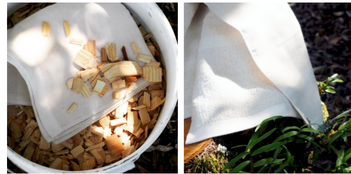
森をつくるフェイスタオル 約345×830×2mm 1,980ポイント