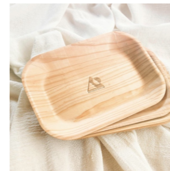
紙皿のようなウッドトレイ10枚セット 丸型Φ207mm5枚+角型235×165mm5枚 2,200ポイント