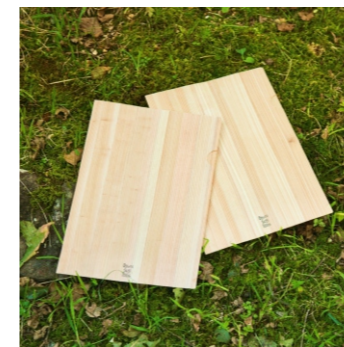
森をつくるA4ファイル 約310×220×1mm 880ポイント/★ノベルティ対応可