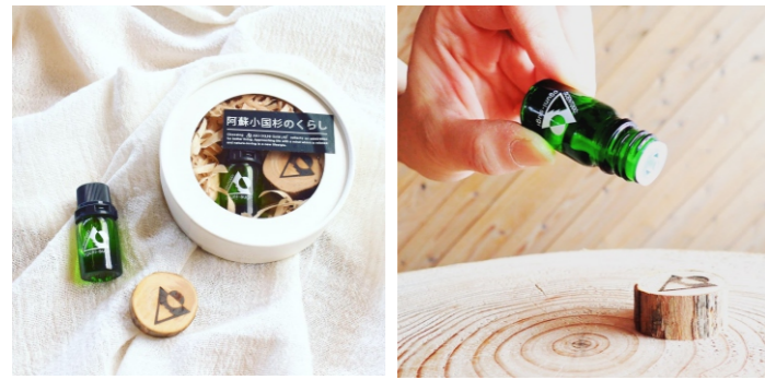
小国の森のエッセンシャルオイル 小国杉精油3ml+木枝 1,760ポイント

★マークの製品（撫で杉、オリジナルノベルティ）などはオーダーメイドとなり、お届けまでひと月以上お待ち頂くことがあります。どうぞ楽しみにお待ちください。写真は全てイメージです。サイズは目安となります。