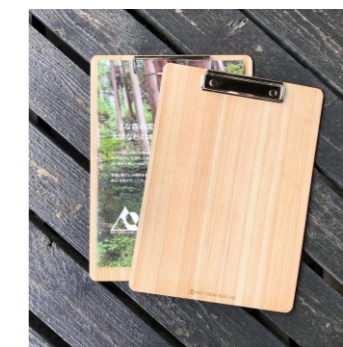
森をつくるA4バインダー 約325×235×3mm 1,650ポイント/★ノベルティ対応可