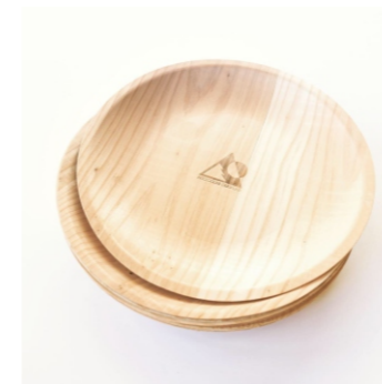
★紙皿のようなウッドトレイ 丸型Φ207mm or 角型235×165mm 220ポイント